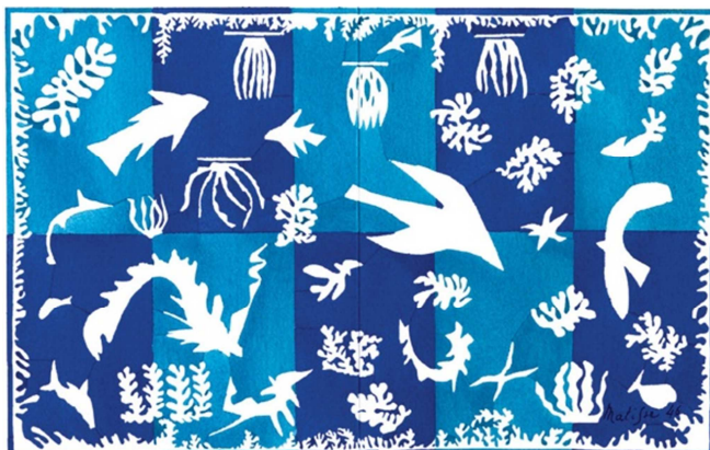
“Polinsia, la mer”