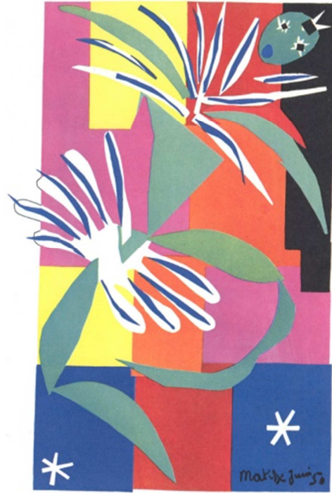
“The creole dancer”