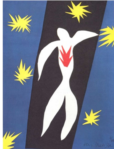
"The fall of Icarus"