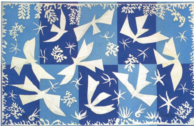
“Polinsia, the sky”