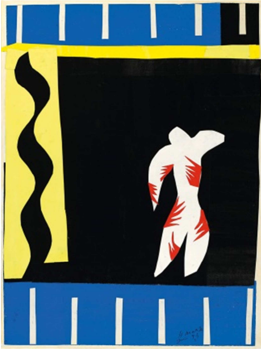
“The clown” (Jazz)